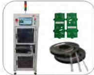
Label-/ Lasermarkierer sowie Etiketten