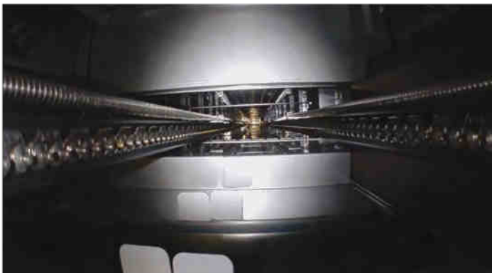
Weitwinkelkameramodul beim Filmen innerhalb des Reflow-Ofens