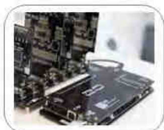
Univers. In-System Programmierer