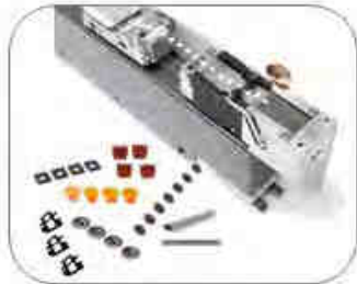
Label Feeder, auch für Spezialteile