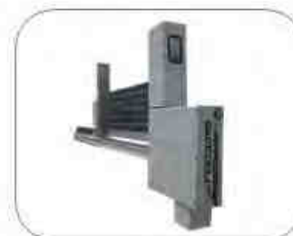
Horizontale Tube Feeder