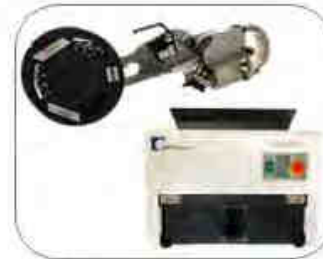
Tape Feeder und Zubehör