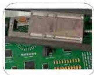
Reflow Inline Videokamera