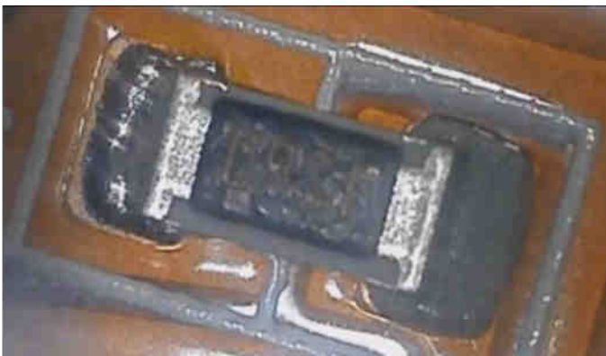
Nahaufnahme-Kamera beim Filmen eines Bauteils auf der Leiterplatte

Es besteht die Möglichkeit, den Prozess zu analysieren und - zum Beispiel bei Vibrationsstörungen - Ursachen zu lokalisieren und abzustellen.