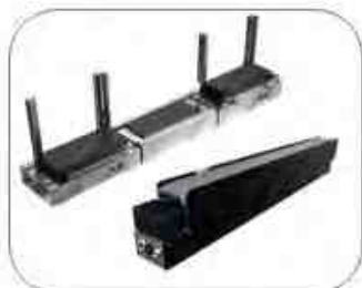
Tray Handler / Reject Parts Conveyor